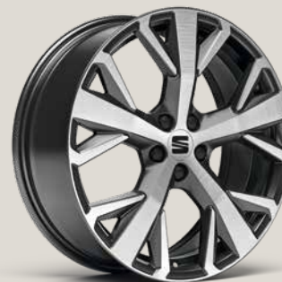
PERFORMANCE NUCLEAR GREY MACHINED XP