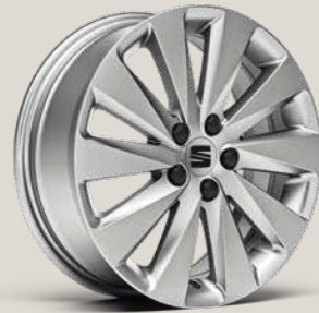
DESIGN BRILLIANT SILVER R St SB

Reference R Style St Style Business Connect SB Xperience Business Connect XP FR Business Connect FB