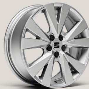
DYNAMIC BRILLIANT SILVER XP