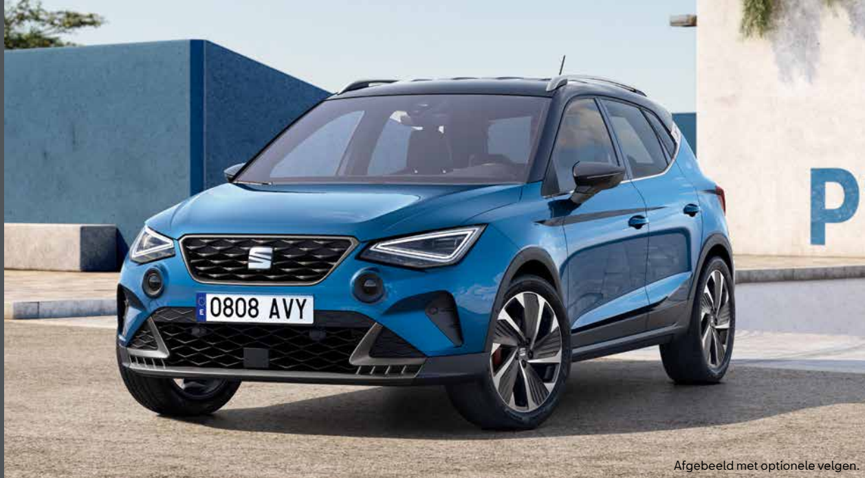
Afgebeeld met optionele velgen.