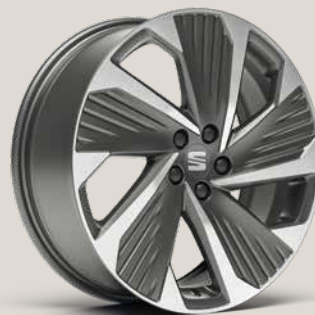
PERFORMANCE COSMO GREY MATTE MACHINED FB