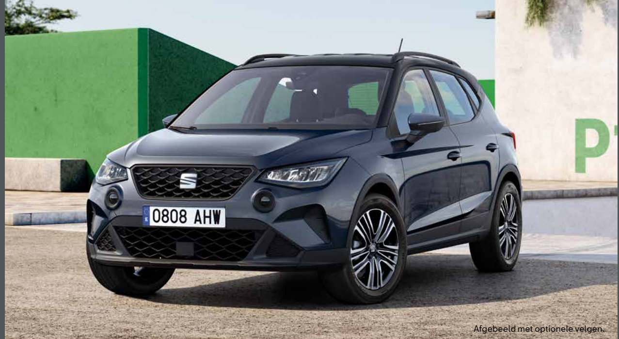
Afgebeeld met optionele velgen.