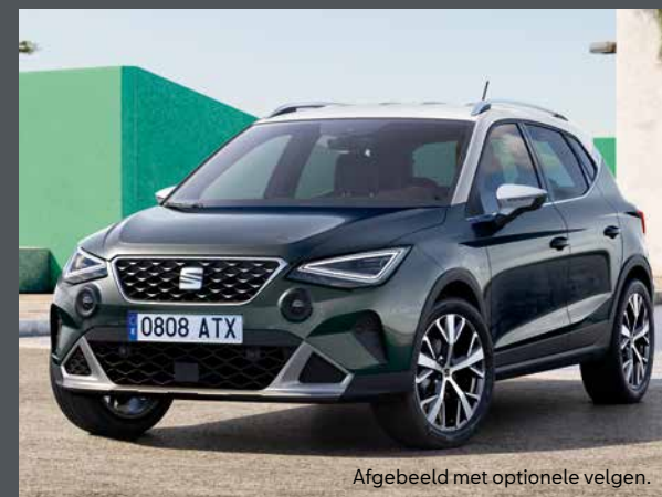
Afgebeeld met optionele velgen.