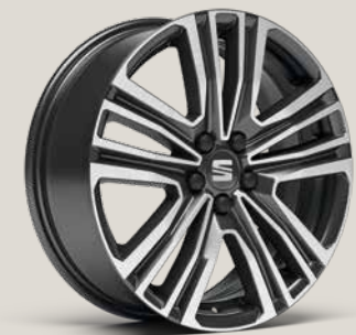
DYNAMIC NUCLEAR GREY MACHINED St SB