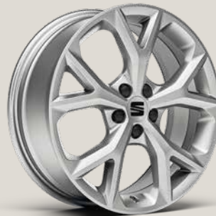
DYNAMIC SPORT BRILLIANT SILVER FB