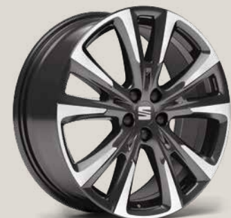
PERFORMANCE NUCLEAR GREY St SB