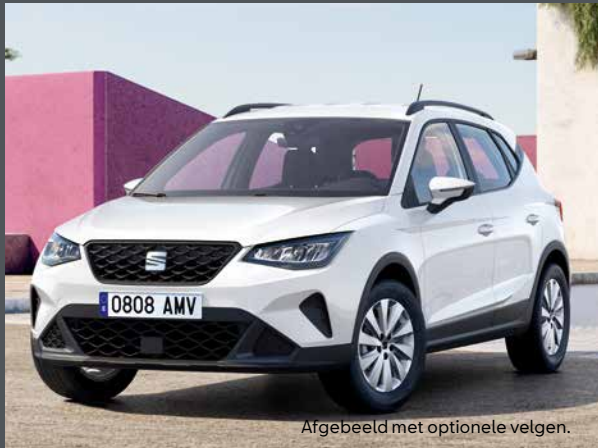
Afgebeeld met optionele velgen.