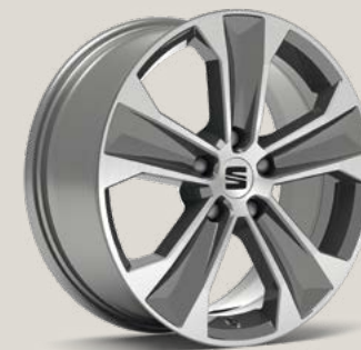
Dynamic Nuclear Grey