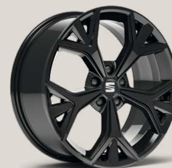
Exclusive Glossy Black FBI PYB