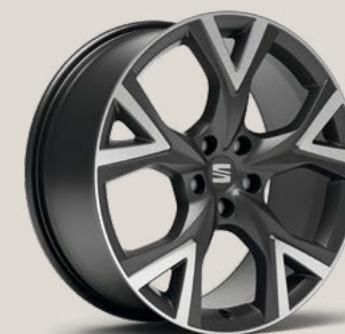
Exclusive Cosmo Grey Type 2 FBI P9A